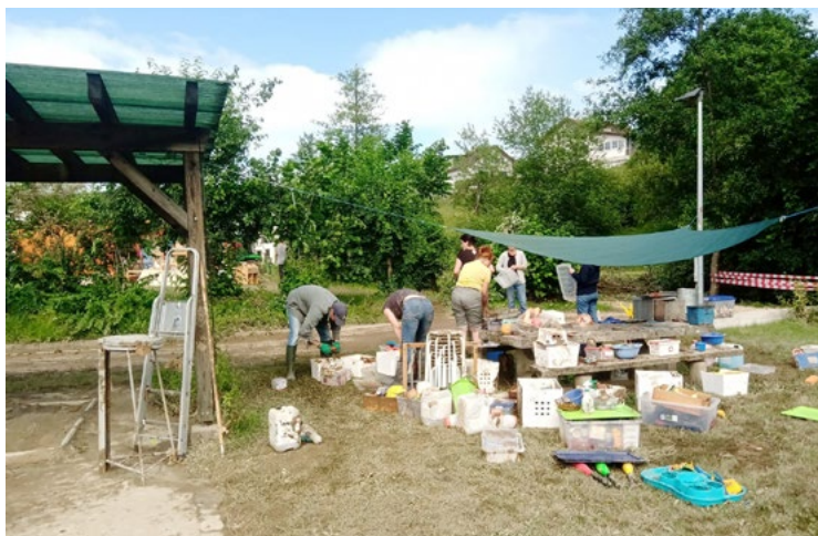
Helpfende bei der Materialtriage des Kindergartens