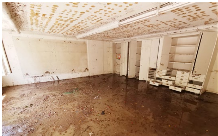
Der Kindergarten von Vordemwald nach der Überschwemmung und Räumung: Ein Totalschaden!

Wir sind sicher, dass wir damit im Sinne unserer Sektionen handeln, von denen viele selbst in die Bedürfnisse der Kinder investieren.