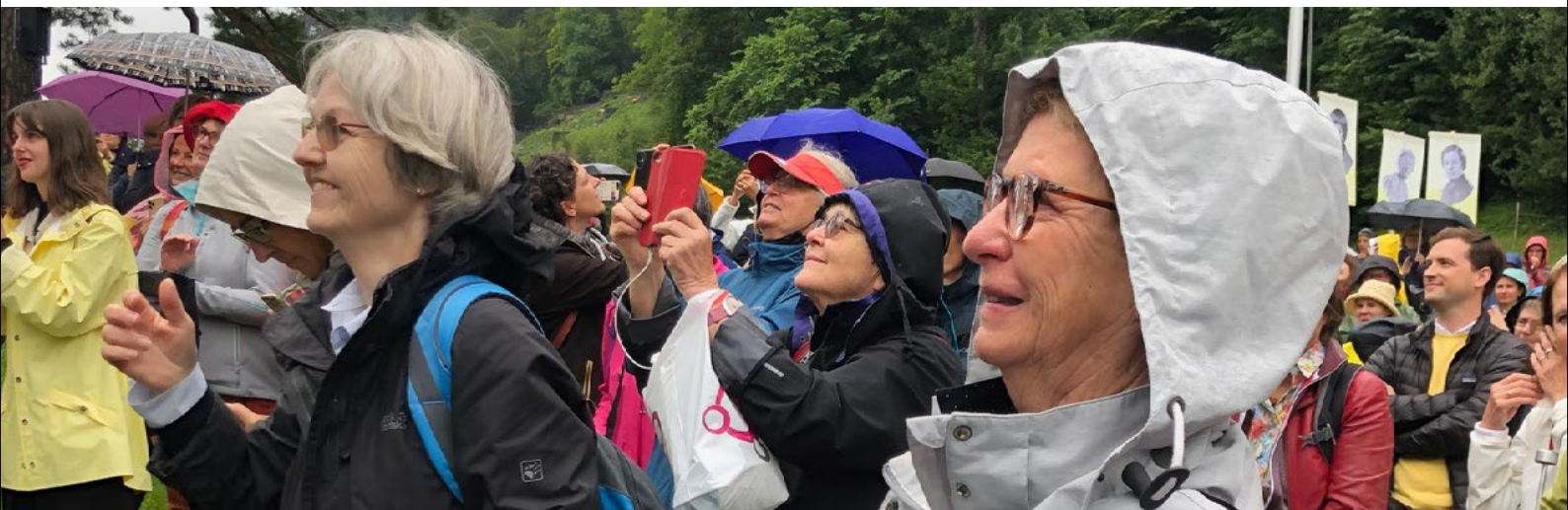
Am historischen «Frauenrütli» 2021